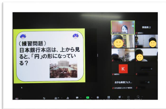
🗨 にちぎんクイズにもオンラインで挑戦！