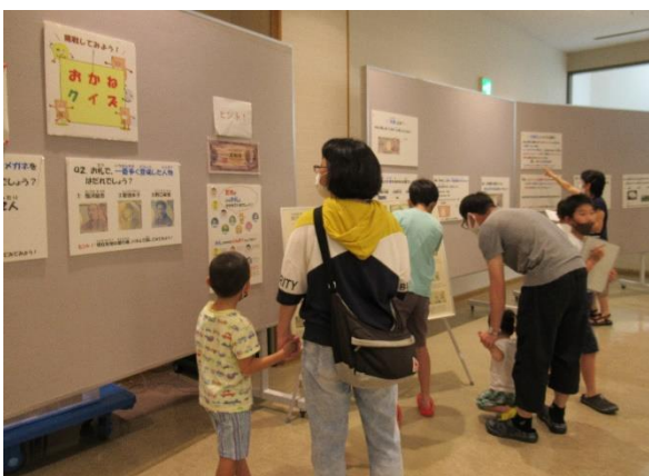
体験プログラムの様子 おかねクイズ