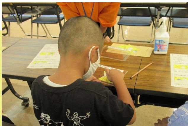
破れたお札の鑑査体験