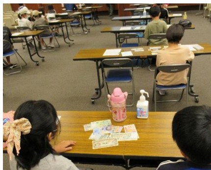
世界の紙幣を見比べました