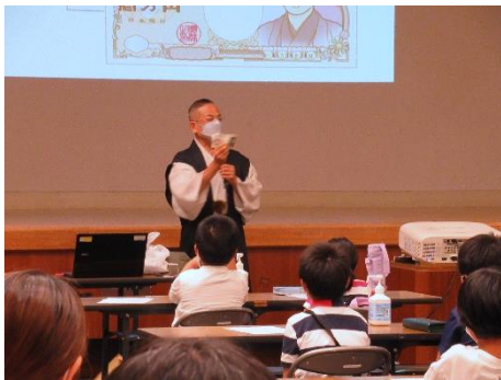
いちのせ先生によるおはなし