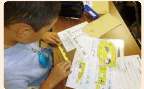
破れたお札、替えてもらえるかな…