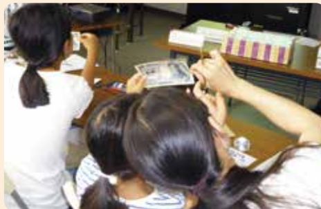
お札のヒミツ、わかるかな？