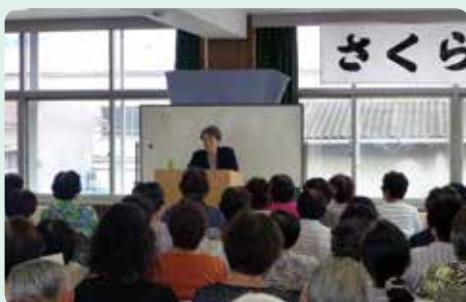
シニア世代の生活設計