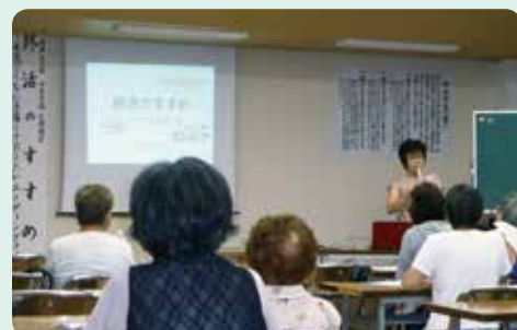
終活についてのおはなし