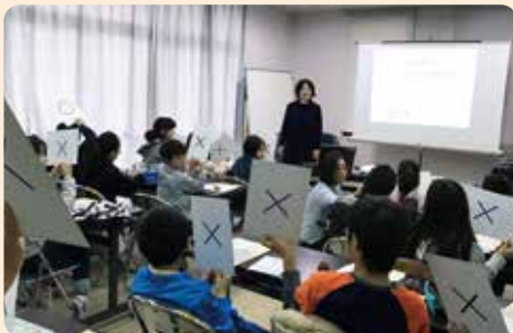
クイズ 全問正解できる？