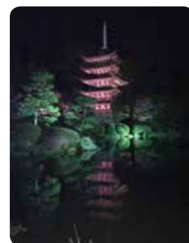
水面にぼんやり映る 山口瑠璃光寺五重塔