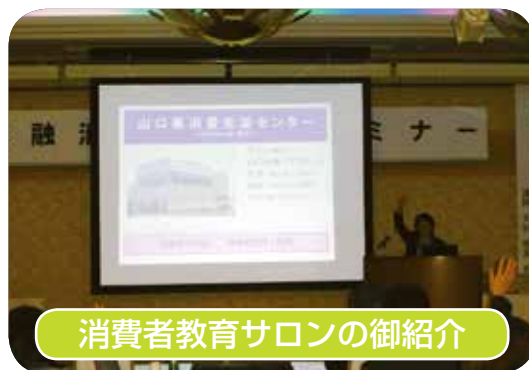
消費者教育サロンの御紹介