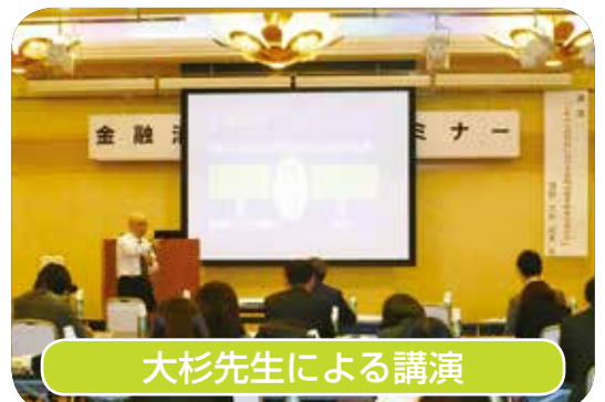
大杉先生による講演